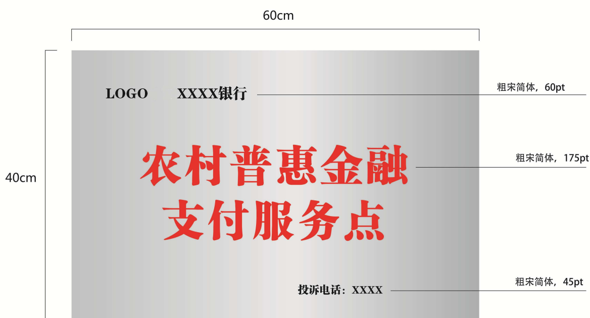
图A.1 农村普惠金融支付服务点标识牌样式

本附录给出了农村普惠金融服务点类型之一的农村普惠金融支付服务点标识牌的样式，如图A.1所示。